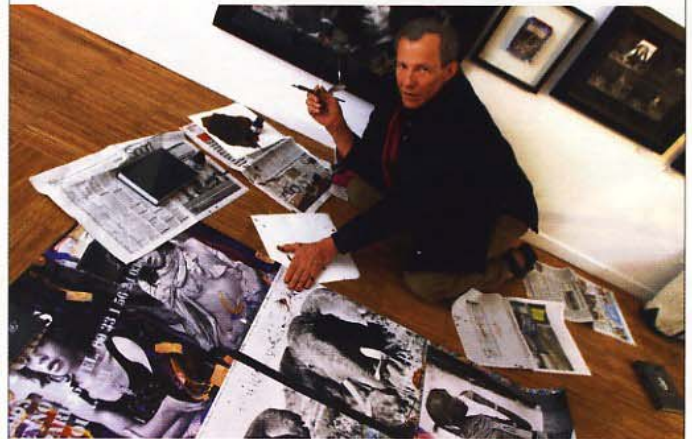
Abenteurer-Künstler Peter Beard inmitten seiner Arbeiten (o.); seine künstlerischen Arbeiten (vorige und folgende Seiten sowie linke Seite) sind Gesamtkunstwerke aus Tagebüchern, Skizzenheften, Collagen und Fotoalben. Sie werden in Galerien der USA zu Höchstpreisen gehandelt

Lauter Fragen, auf die ich bis heute nicht alle Antworten weiß, obwohl ich auf seiner Fährte geblieben bin. Je mehr ich über ihn erfuhr und je widersprüchlicher die Informationen waren, umso größer wurde mein Interesse. Aber meine Versuche, ihn persönlich zu treffen, scheiterten ein ums andere Mal. Selbst Freunde und enge Mitarbeiter verloren immer wieder seine Spur. Da Heldenverehrung aus der Ferne am besten funktioniert, erschien er mir bald überlebensgroß – ein fliehendes Standbild.