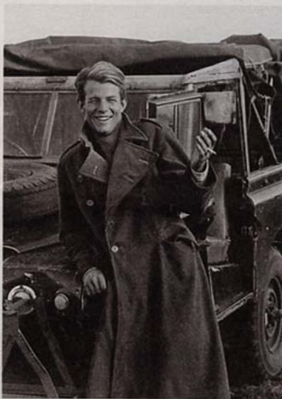
KENIA. Peter Beard, en Aberdare Moorlands (Kenia, 1966). El neoyorquino viajó a África en 1955 y regresó en los sesenta para trabajar en el parque nacional Tsavo, donde tomó fotos para su libro 'The end of the game'. Al lado, tres de ellas.

En definitiva, Peter Beard es el autor de ese libro triste, el ensayo-denuncia que le hizo famoso, The end of the game (publicado en 1963 y reeditado en 1965, 1977, 1998, y ahora, por la casa alemana Taschen, en 2008), en el que plantea nuestra destrucción como especie según avanza la del territorio. ¿Por qué? "El juego incluye a ambos, el cazador y el cazado; es el deporte y el trofeo. El juego está matando al juego. Hace sólo 50 años, el hombre tenía que protegerse de las bestias; hoy son éstas las que deber ser protegidas por el hombre", escribió en el prólogo de 1965. "¿Cambio climático?", se ríe. "No es el clima el