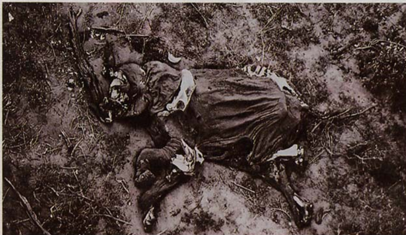
ESQUELETOS. Una de las fotografías aéreas de Peter Beard del parque Tsavo en los años sesenta: donde antaño había grandes extensiones arboladas yacían restos de hasta 35.000 elefantes extintos.

> A Beard le gusta provocar. "La solución", sigue, moviendo sus grandes manos, "es la educación. Formarnos en las leyes de la naturaleza, recuperar a Darwin, respetar la selección natural. No dar de comer por dar de comer. Tres millones de niños enfermos de sida hay en Suráfrica, pero ¿qué sentido tiene eso? Cada década, la población del mundo aumenta en ¡mil millones! No hay hábitat que lo resista". ¿Pero no es la vida un derecho y la asistencia sanitaria cuestión de justicia? Respuesta: "Un error". Y sigue él sin atender: "Son enfermedades propias de la superpoblación". Y no, no le parece horrible decirlo: "Lo horrible es no hacer nada por impedirlo".