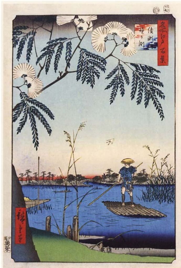
DER FLUSS AYASEGAWA UND KANEGAFUCHI, 1857 (LINKS), TROMMELBRÜCKE VON MEGURO UND SONNEN- UNTERGANGSHÜGEL, 1857

schnitte war die Stadt von einem verheerenden Erdbeben erschüttert worden. So sind Hiroshiges Holzschnitte, die in einer Auflage von etwa fünfzehntausend Stück bald reißenden Absatz fanden, auch eine Huldigung an die Leistung des schnellen Wiederaufbaus: Sie dokumentieren ein japanisches Wirtschaftswunder des 19. Jahrhunderts. Den Impressionisten, die mit den Augen Hiroshiges zu sehen gelernt hatten, erschien die Provence danach in einem neuen Licht. Heute sehen wir diese Drucke wiederum mit anderen Augen. Denn wenig wusste van Gogh von der Fotografie, die in den Raumkompositionen des Japaners vorweggenommen zu sein scheint. Am Bildrand angeschnittene Objekte, Vögel, die wie zufällig ihren Kopf ins Motiv recken, oder das Lichtspiel eines Feuerwerks am Abendhimmel – Hiroshige fängt Momentaufnahmen ein, als hätte ein Fotograf mit kurzer Belichtungszeit den Auslöser betätigt.