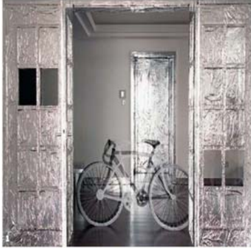
Página anterior: desde el comedor del ático del fotógrafo y arquitecto Richard Hsu se aprecia el avance de los rascacielos en los barrios tradicionales