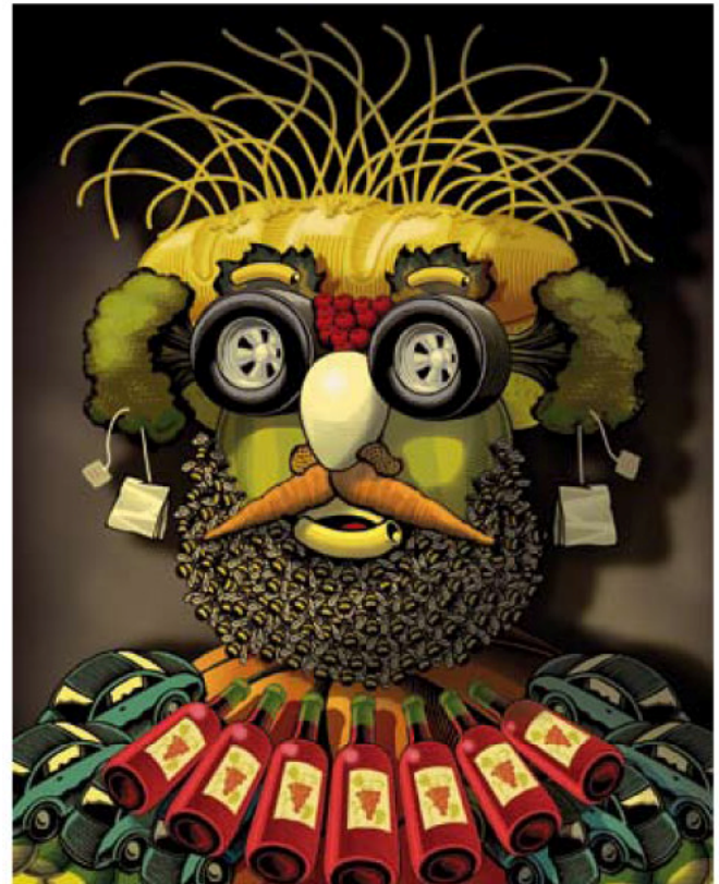
· Arriba, imagen de Herr Mueller. · A la derecha ilustración de Chris Gall