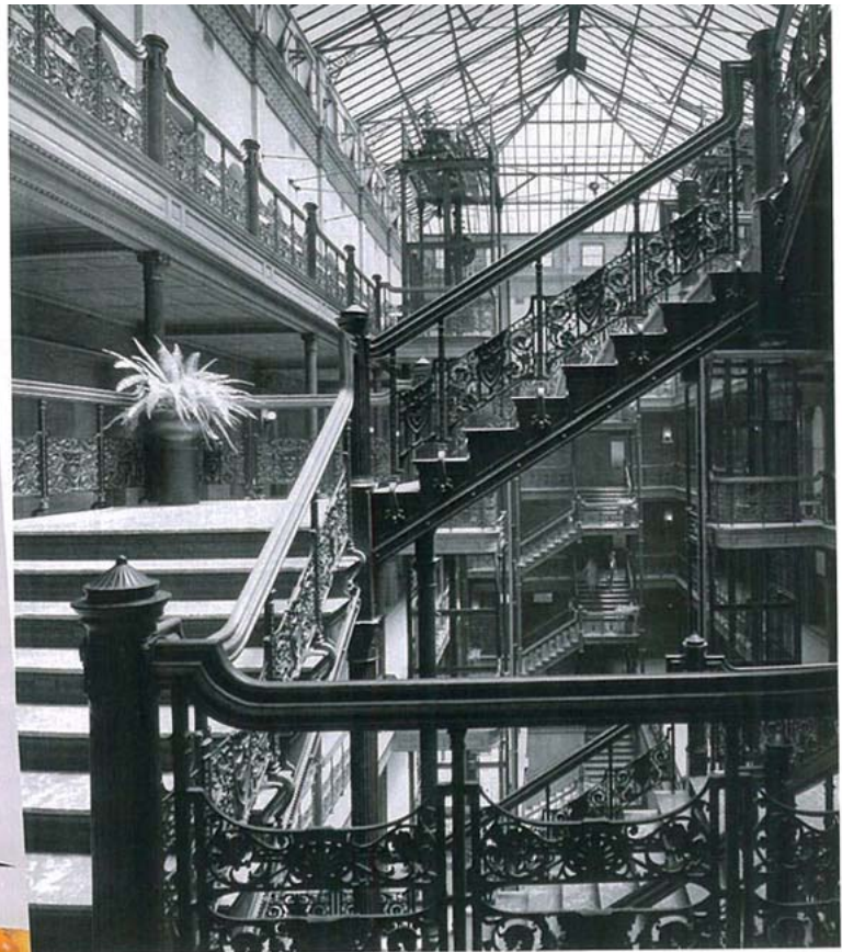
Ci-dessus , l'atrium du Bradbury Building (1893), à Los Angeles, qui combine la modernité de vastes ouvertures au vocabulaire du XIX e siècle - bois verni, carrelage, balustrades de fer forgé. A gauche , la cuisine de Case Study House # 21, un édifice de Pierre Koenig terminé en 1958 et restauré depuis peu.

verni, fer forgé et carrelage sont sous le choc de ce que j'appelle «l'acoustique visuelle». Comme une grande salle de concerts où le son se développe de manière harmonieuse, le Bradbury n'a pas d'espace vacant. Partout la composition est parfaite.