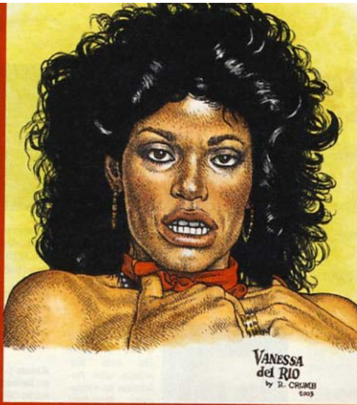
VANESSA del RIO by R. CRUMER 2003