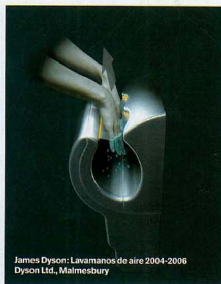
James Dyson: Lavamanos de aire 2004-2006 Dyson Ltd., Malmesbury