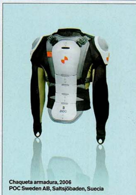
Chaqueta armadura, 2006 POC Sweden AB, Saltsjöbaden, Suecia