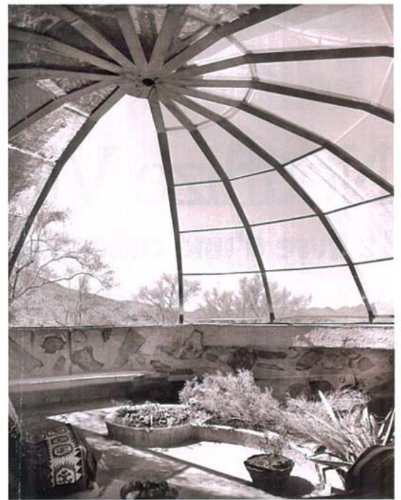
Residence Woods ("The Dome House") par Soleri & Mills, Cave Creek, Arizona, 1950.

rière lancée pour couvrir près de huit décennies et obtenir ses récompenses : l'Architectural Photography Medal de l'American Institute of American Architects en 1969 et la consécration de l'hommage de l'International Center of Photography de New York en 1998. A beau sujet belles images et Julius Shulman a su imprimer sa marque à ses représentations à la chambre, qu'il animait par l'introduction de personnages parfois sollicités dans sa propre famille. Ce long parcours à travers des époques que le mobilier date plus facilement que des espaces que la