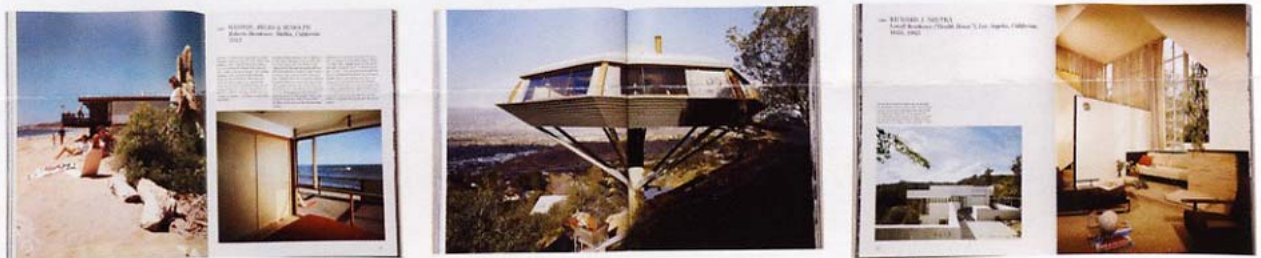
Von links: Fotos der „Roberts Residence“ in Malibu, Kalifornien, 1953, Band 1. Das berühmte „Chemosphere House“, entworfen von John Lautner, Los Angeles, 1961, Band 2. „Health House“ von Richard Neutra, Los Angeles, 1950, 1965, Band 1.

10. 10. 1910 in New York geboren, begeistert die Fachwelt mit einer innovativen, ausgefeilten Technik und provoziert mit Aussagen wie: „Fotografieren ist doch ganz leicht!“ 1985 ging Julius Shulman offiziell in den Ruhestand: „Etwa eine Woche lang!“ hielt er es aus. Ein „Comeback“ feierte er auch in A&W 2/06, Interview und Artikel sind nachzulesen auf awmagazin.de/go/200602 . Julius Shulman, Modernism Rediscovered , Taschen Verlag, 1008 S., 3 Bände im Schuber, 29 x 36,8 cm, 250 Euro.