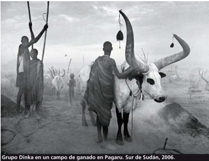
Grupo Dinka en un campo de ganado en Pagaru. Sur de Sudán, 2006.