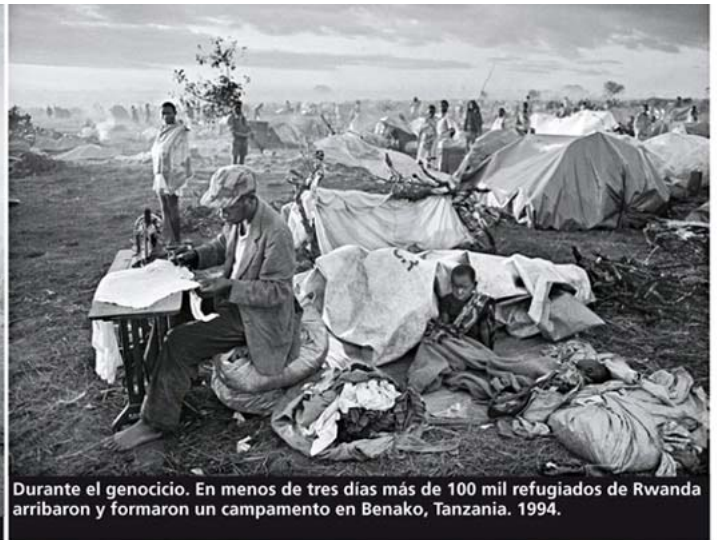
Durante el genocidio. En menos de tres días más de 100 mil refugiados de Rwanda arribaron y formaron un campamento en Benako, Tanzania. 1994.