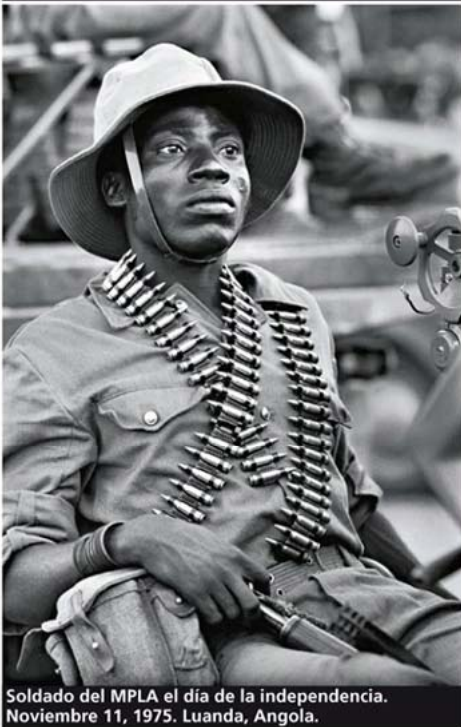
Soldado del MPLA el día de la independencia. Noviembre 11, 1975. Luanda, Angola.