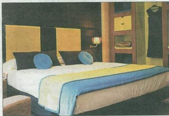
Habitación del 987 Hotel Barcelona, recomendado en la guía de Angelika Taschen.

quedamos perdidos. Así lo expresa en la introducción: "Desde la celebración de los Juegos Olímpicos en 1992, muchos catalanes parecen obsesionados por mostrar su cara más moderna y procuran recubrirlo todo con una pátina de diseño". Un sinnúmero de establecimientos se han reformado completamente, provocando un efecto en general positivo, dice, pero muchas veces también mediocre y desangelado. "Para este libro me he lanzado a la búsqueda de la modernidad elegante... y de viejas pensiones, cafés y restaurantes por los que apenas ha pasado el tiempo". Delicatessen . Caprichos. Sensaciones. Ése es el objetivo: recorrer calles en busca de rincones estrechos y amplios espacios, de tiendas menudas de velas, alpargatas, café torrefacto... De hostales años treinta