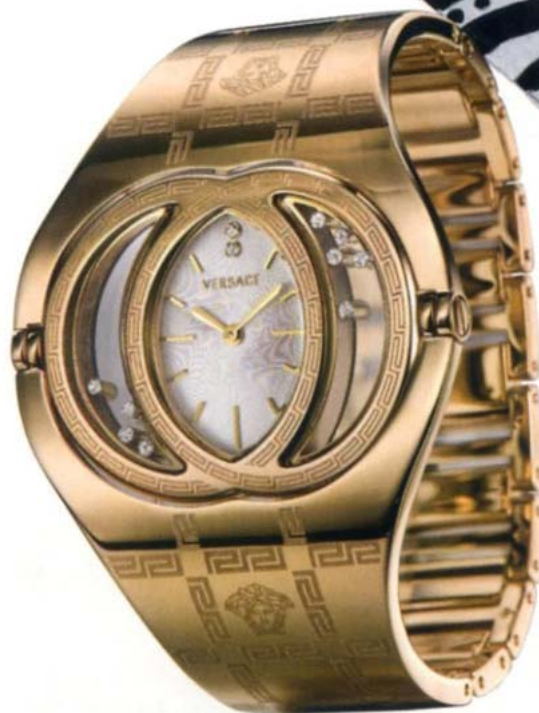
Arriba, boceto de Gianni Versace, creador de la firma fallecido hace 10 años, y el reloj histórico de la firma italiana Eclissi .

Above, a sketch by Gianni Versace, creator of the firm named after him who passed away 10 years ago, and Eclissi , the Italian label's historic watch.