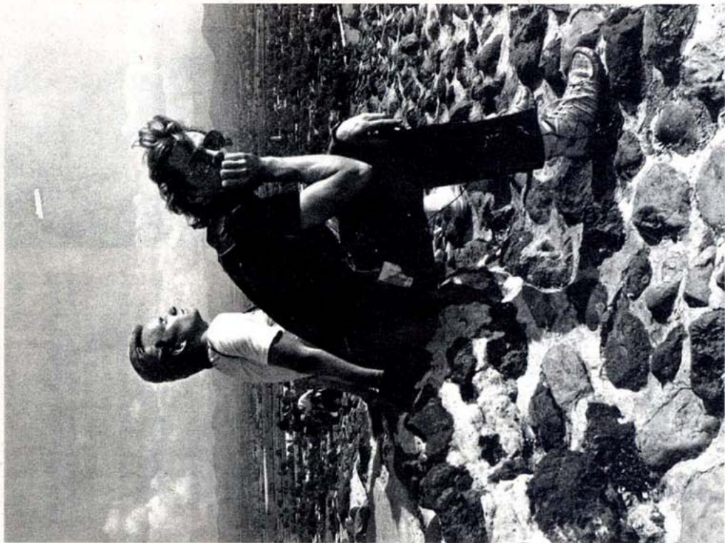
■ Stewart Copeland en Sting, Teotihuacán Piramide, Mexico, 1980.

Summers' fotowerk - dat schatplichtig is aan Diane Arbus, Henri Cartier-Bresson, Walker Evans en Gary Winogrand - toont de aanzwellende tsunami van succes. De opeenstapeling van stadions en concerthallen, van schreeuwende massa's en de creatieve strijd in de studio. Maar er is ook de ontheking en psychologische verworping. De groupies, de 'uitgestreken druggezichten, de toch al grote ego's die groter en groter worden, de bandleden die steeds minder zichzelf zijn en steeds meer hun eigen imago naspelen. En dan, opeens, als een voltreffer in je gezicht: Copeland met zijn baby op de arm, ergens op een Engels platteland dat is ontstaan van associaties met roem en succes. Een mens, en niet de monsterachtige zwelbast die in spotlamplicht is ontstaan.