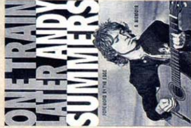
ANDY SUMMERS One Train Later Thomas Dunne Books, hardcover, 23,99 euro. Plakus Books, paperback, 14,99 euro.

The Police speelt op 8 en 9 oktober in Antwerpen.