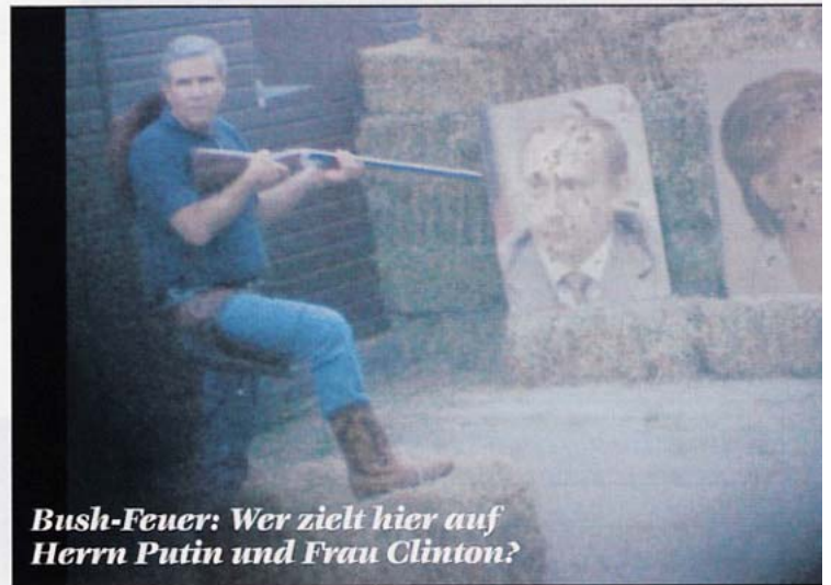
Bush-Feuer: Wer zielt hier auf Herrn Putin und Frau Clinton?