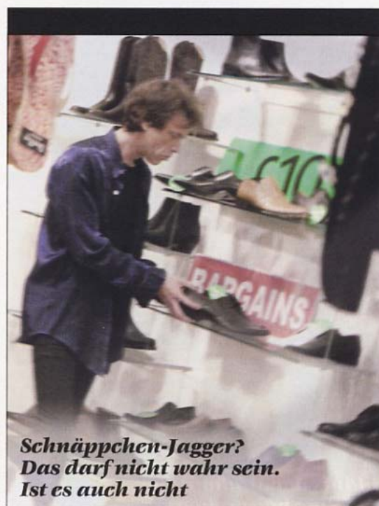
Schnäppchen-Jagger? Das darf nicht wahr sein. Ist es auch nicht