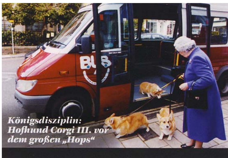
Königsdisziplin: Hofhund Corgi III. vor dem großen „Hops“