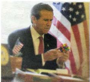
Probleemoplosser: 'President Bush' worstelt met de kubus van Rubik.