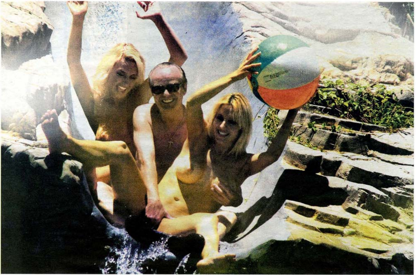
Dikke pret: 'Jack Nicholson' is zich altijd bewust van de camera en grijpt, op zijn manier, net op tijd in.