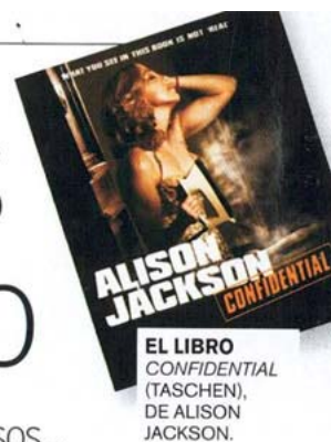
EL LIBRO CONFIDENTIAL (TASCHEN), DE ALISON JACKSON.

Ni siquiera los ricos y famosos... Alison Jackson juega al despiste en Confidential , un chocante libro sobre «la otra cara» de los vips