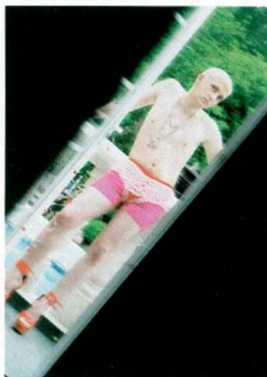
¿Le gusta a Eminem ponerse lencería femenina en la intimidad? Alison Jackson cree que sí...

¿Es invisible, esta reina de los paparazzi? ¿Cómo lo hace? Pues con dobles, claro. Sus falsas exclusivas fotográficas demuestran que hay que ver para creer, aunque la verdad sea completamente diferente a lo que se ve. "Lo parecido se transforma en auténtico, la fantasía se hace realidad con mis fotos", explica Alison, "potencio la relación psicológica entre lo que se ve y lo que se imagina, es parte de nuestra