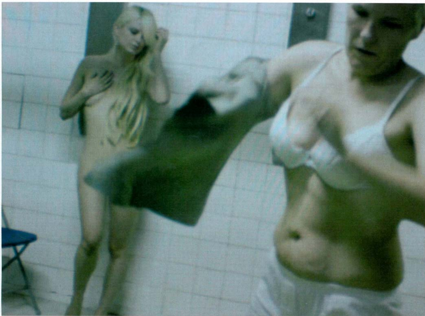
¿Es Paris Hilton en la cárcel? Si así fuera estas fotos valdrían una fortuna. Pero es una recreación de algo que no pasó exactamente así aunque pudo suceder.