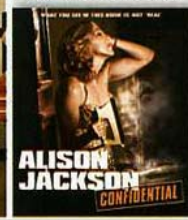
GESCHICHTEN-ERZÄHLERIN Das neue Buch »Confidential« von Alison Jackson, 37, ist im Taschen Verlag erschienen und kostet 29,99 Euro

Beckham. Und Prinz William mit der Queen. Auch Brad Pitt ist fantastisch. Und Tony Blair, obwohl ich ihn im wirklichen Leben nicht mag, weil er es mit der Wahrheit nicht so genau nimmt. Kann man sich bei Ihnen bewerben? Klar. Ich bekomme monatlich tausende von Bewerbungen. Doch die meisten Doppelgänger finde ich zufällig auf der Straße. Wer wäre Ihr Traum-Doppelgänger? Ich suche nach unserem neuen Premierminister Gordon Brown. Der sieht sehr eigen aus, das wird schwer. Welche Reaktionen beobachten Sie, wenn Sie mit Doppelgängern unterwegs sind? Ich war mal mit den Fake-Beckhams in Madrid und Japan. Die Leute wurden regelrecht hysterisch. Obwohl ich alle aufklärte, wollten sie trotzdem Fotos machen. Mit einem Richard-Gere-Doppelgänger wurde ich vom Kellner aus dem Restaurant geworfen, weil er dachte, ich belästige seinen prominenten Gast. Anschließend verfolgten uns Horden von Mädchen.