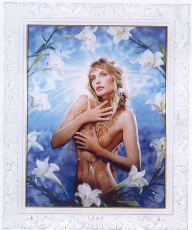
Extase, Arielle Dombasle, 2002

Entre grandes nomes adeptos deste movimento, como Andy Warhol e Jasper Johns, ambos homossexuais, tornaram-se internacionalmente conhecidos como dupla, unidos não apenas pela arte, os franceses Pierre & Gilles. Os artistas plásticos marcaram a segunda metade do século XX, como líderes da queer art. Há trinta anos a viver e a produzir juntos, usam a fotografia como meio de expressão, que Pierre executa, com acabamentos em pintura manual, a arte de Gilles. Assim, cada obra adquire um carácter único e original, graças à finalização das fotografias que é sempre manual. No fundo, os artistas anteciparam a técnica de tratamento de imagem, que só se tornou possível para a maioria das pessoas com a introdução de novas tecnologias de tratamento de imagem digital.