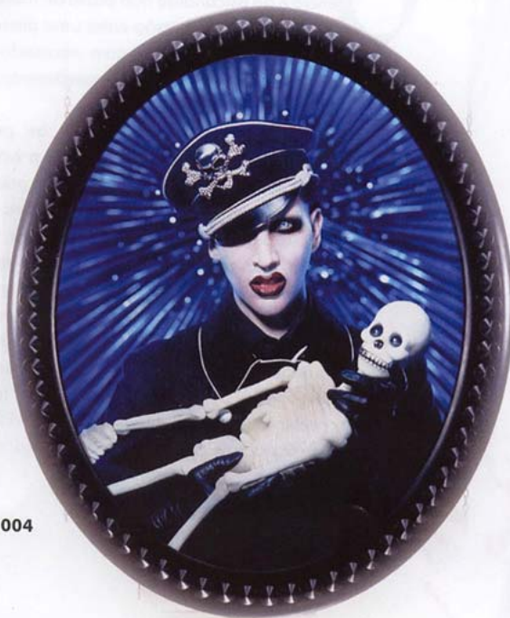
The dead song, Marilyn Manson, 2004