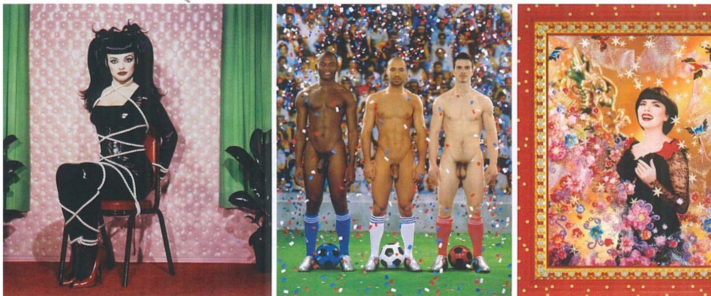
DE GAUCHE À DROITE : Nina Hagen (1993), Vive la France (2006) et Fleurs de Shanghai (2005).

en studio, et pris souvent très classiquement, de face ou de trois-quarts. Travailler en cheville leur est venu simplement, dans la foulée de la rencontre et de leurs formations respectives. Ils doivent leurs premières commandes au journal français Façade qui les confronte à Andy Warhol, Salvador Dalí, Mick Jagger, Yves Saint Laurent ou Iggy Pop... pour un portrait très Pop Art aux yeux hallucinés. Leur style est déjà imprimé, comme s'ils jetaient publicités flashy et sculptures grecques avec une pincée de cuir clouté dans la marmite des Chamallows. Trente ans, depuis les premiers portraits de 1977, qu'ils complotent avec une esthétique constante dans l'intimité de leur atelier.