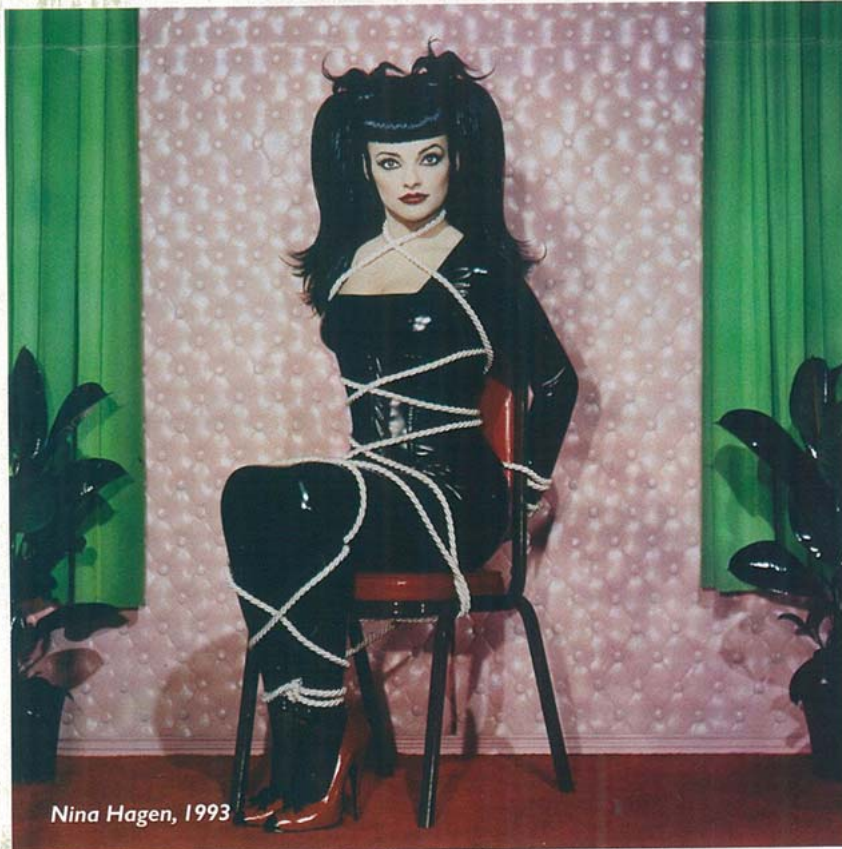
Nina Hagen, 1993