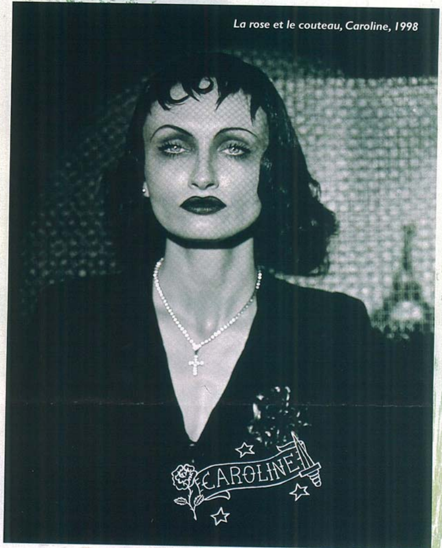
La rose et le couteau, Caroline, 1998

inspirations et influences. Mais qui sont les artistes contemporains qui inspirent Pierre & Gilles?