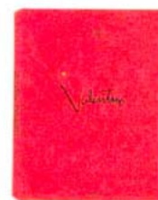
Una grandiosa historia italiana: Valentino Garavani.

Ningún diseñador tan grande ha alcanzado jamás la meta de permanecer por tanto tiempo como la fuerza y el alma creativa de la compañía que lleva su nombre, y después de 45 años, para él llegó la hora de decir adiós.