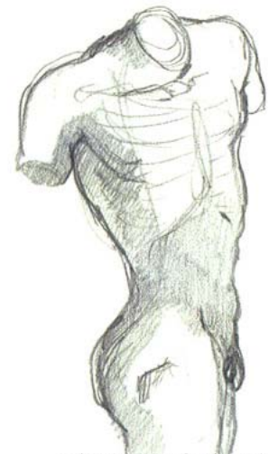
Tekeningen verraden de inspiratiebronnen van Calatrava. Zo mondt de draaiing van de romp uit in het gebouw Turning Torso in het Zweedse Malmö.