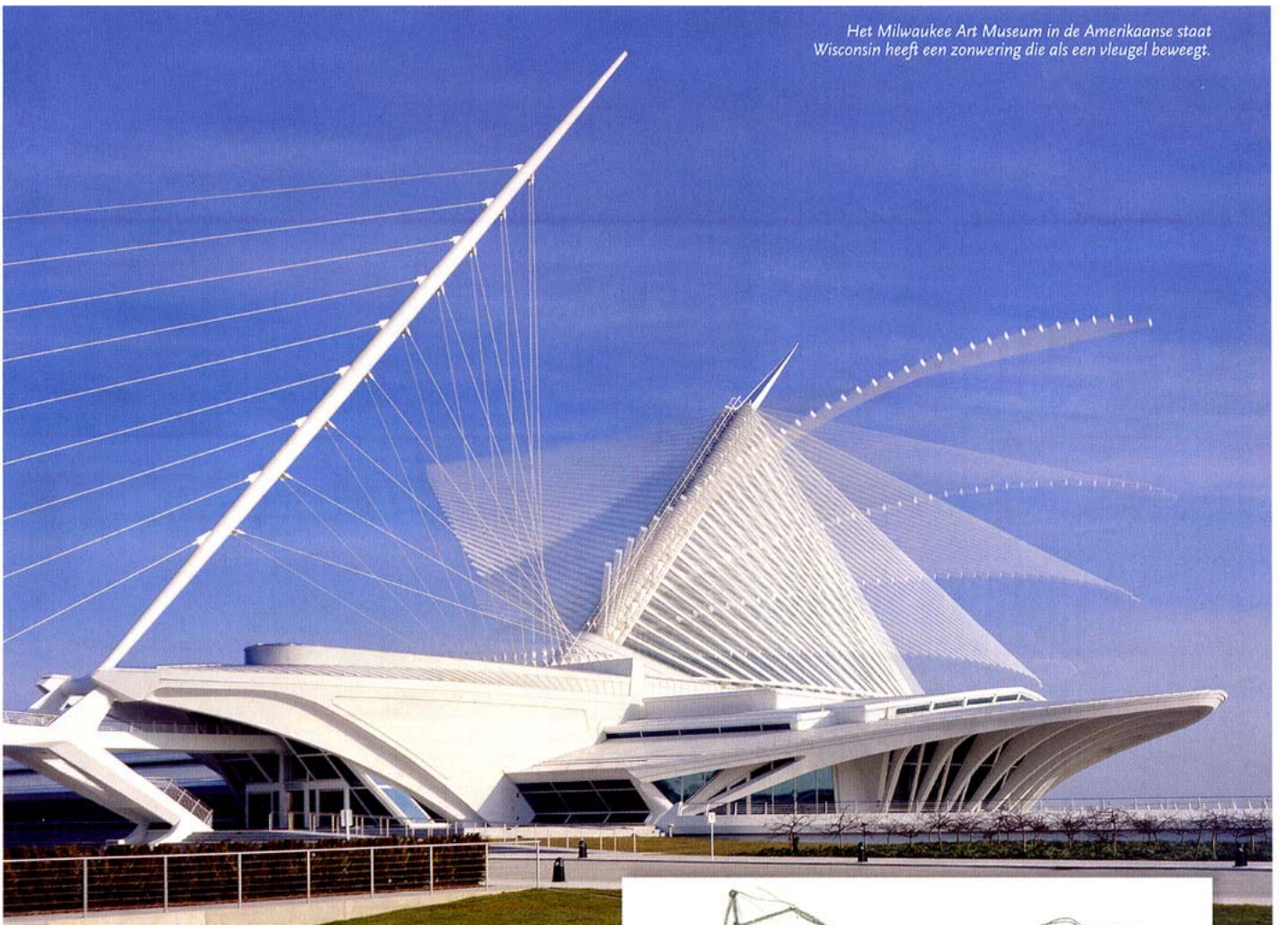
Het Milwaukee Art Museum in de Amerikaanse staat Wisconsin heeft een zonwering die als een vleugel beweegt.

De inspiratie van Calatrava is niet in al zijn werk even expliciet. Vaak is de vorm waarop het kunstwerk is gebaseerd, sterk gestileerd of geabstraheerd. Het Oriente Station in de Portugese hoofdstad Lissabon illustreert dit duidelijk. De vele schetsen van Calatrava laten zien dat de dragende structuren van de overkapping geïnspireerd zijn op bomen. Een van de schetsen koppelt de structuur ook aan een gekruisigd persoon: een krachtig, minder voor de hand liggend beeld dat voortaan altijd naar boven komt bij het zien van dit bouwwerk.