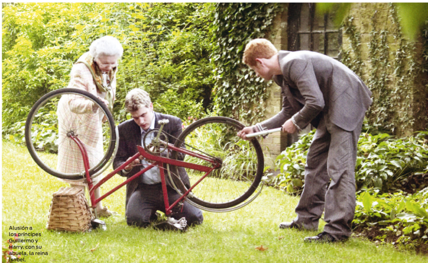
Alusión a los príncipes Guillermo y Harry, con su abuela, la reina Isabel.

»Trato de llegar al límite, al punto inconsciente más alto entre lo que vemos y lo que imaginamos.«