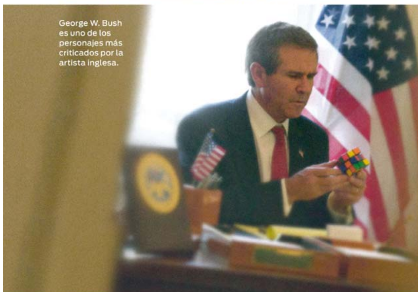
George W. Bush es uno de los personajes más criticados por la artista inglesa.