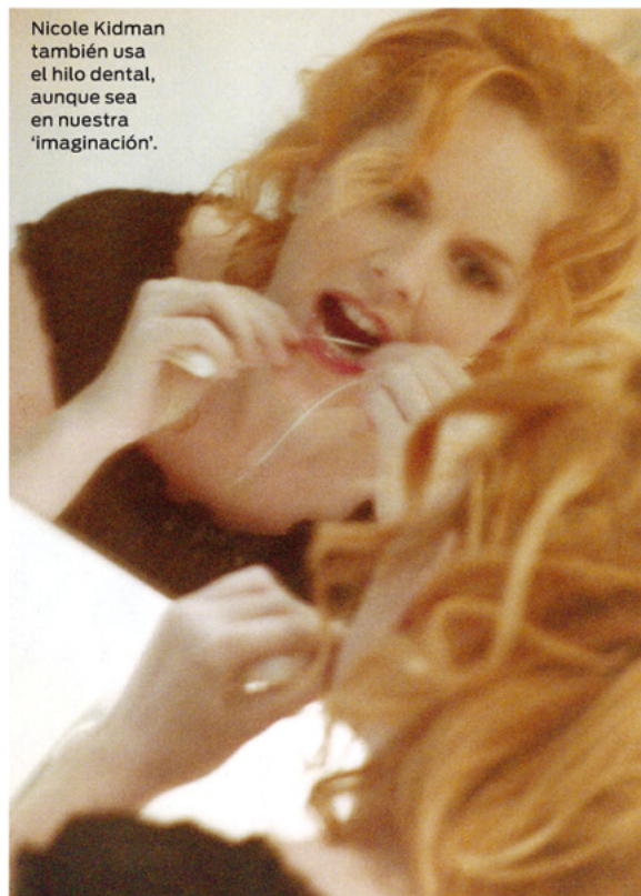
Nicole Kidman también usa el hilo dental, aunque sea en nuestra 'imaginación'.

Como sea, esta mujer ha dado con la fórmula para triunfar en plena efervescencia por las trivialidades de los famosos. Y, aunque se cuestione su trascendencia artística en un mundo en el que se paga tanto dinero por la intimidad de éstos, ¿quién puede juzgarla por simular lo que muchos quieren ver?