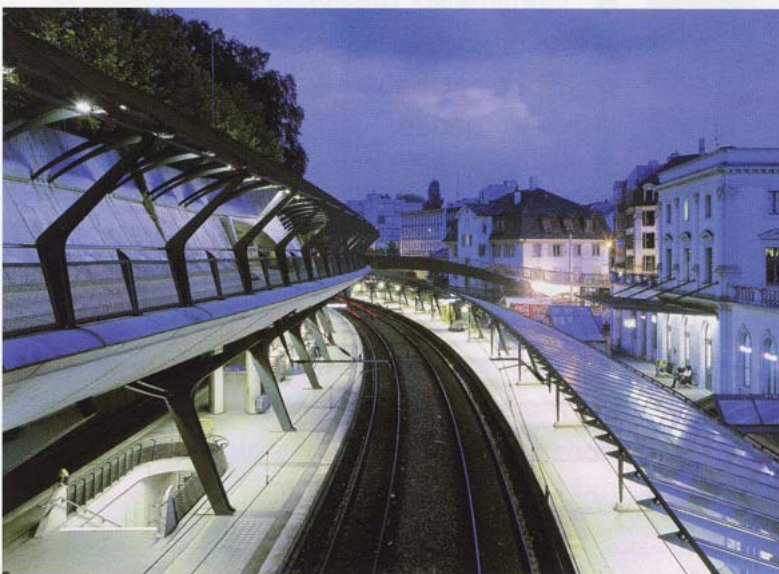
Bahnhof Stadelhofen, Zürich