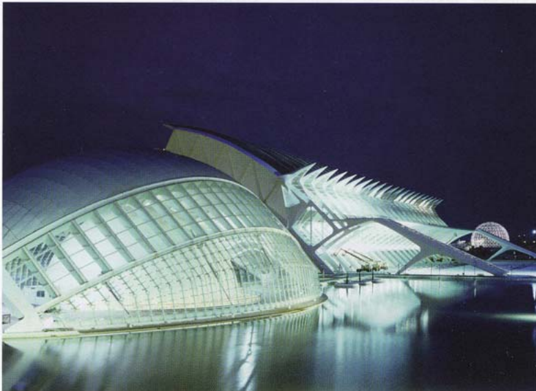
Kunst- und Wissenschaftsstadt Valencia

Namen gemacht – und blickt über die Grenzen des Kontinents hinaus. Er ist bisher der einzige Architekt, dessen Werk sowohl im Museum of Modern Art als auch im Metropolitan Museum von New York ausgestellt wurde. Derzeit entwirft er den Bahnhof für Ground