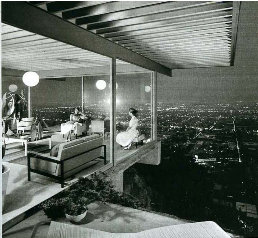
Shulman-Fotografie „Case Study House Nr. 22“ (1960): „Es war alles so einfach“