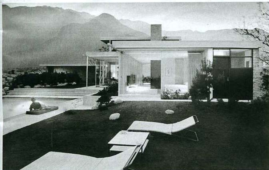
Shulman-Fotografie „Kaufmann House“ (1947): Die Hausherrin als Blendschutz

sieht ihn an seinen Ohren, da lösen sich immer wieder ein paar Hautfetzen. Wie man so alt werde? Shulman denkt keine Sekunde nach. „Glücklich sein.“