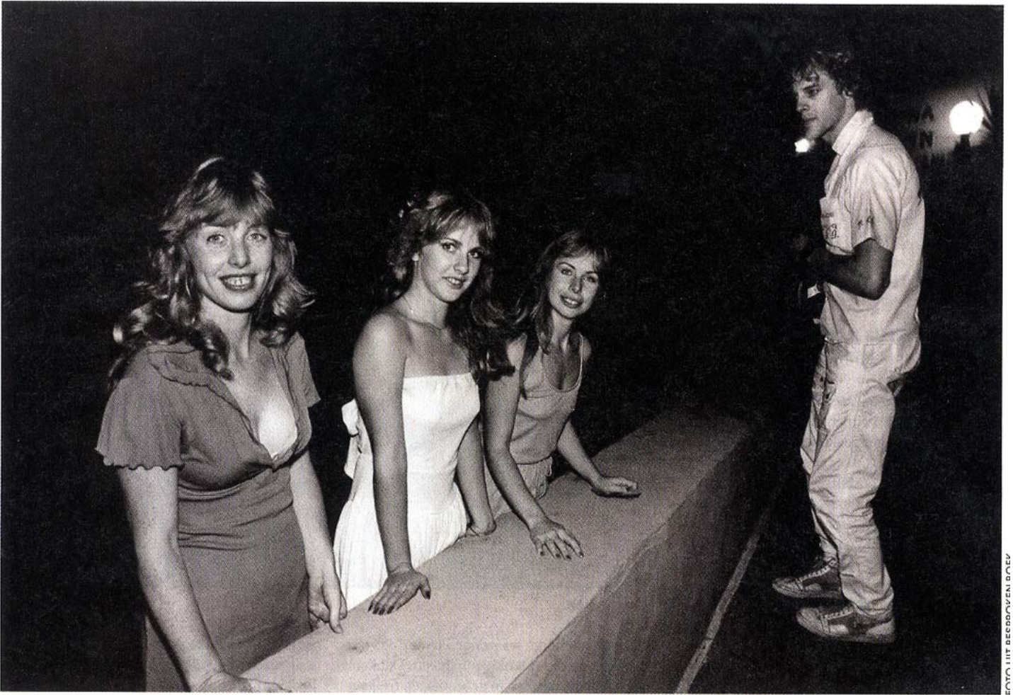
september 1982, Stewart Copeland