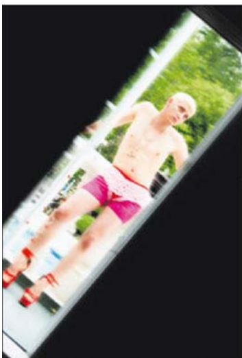
Le rappeur Eminem laissant entrevoir sa part de féminité...