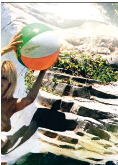
L'acteur Jack Nicholson semble prendre son pied en compagnie de deux créatures blondes...