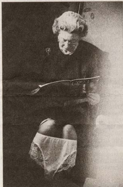
Heißer Schlüpfel! Die Queen privat. Oder nicht?