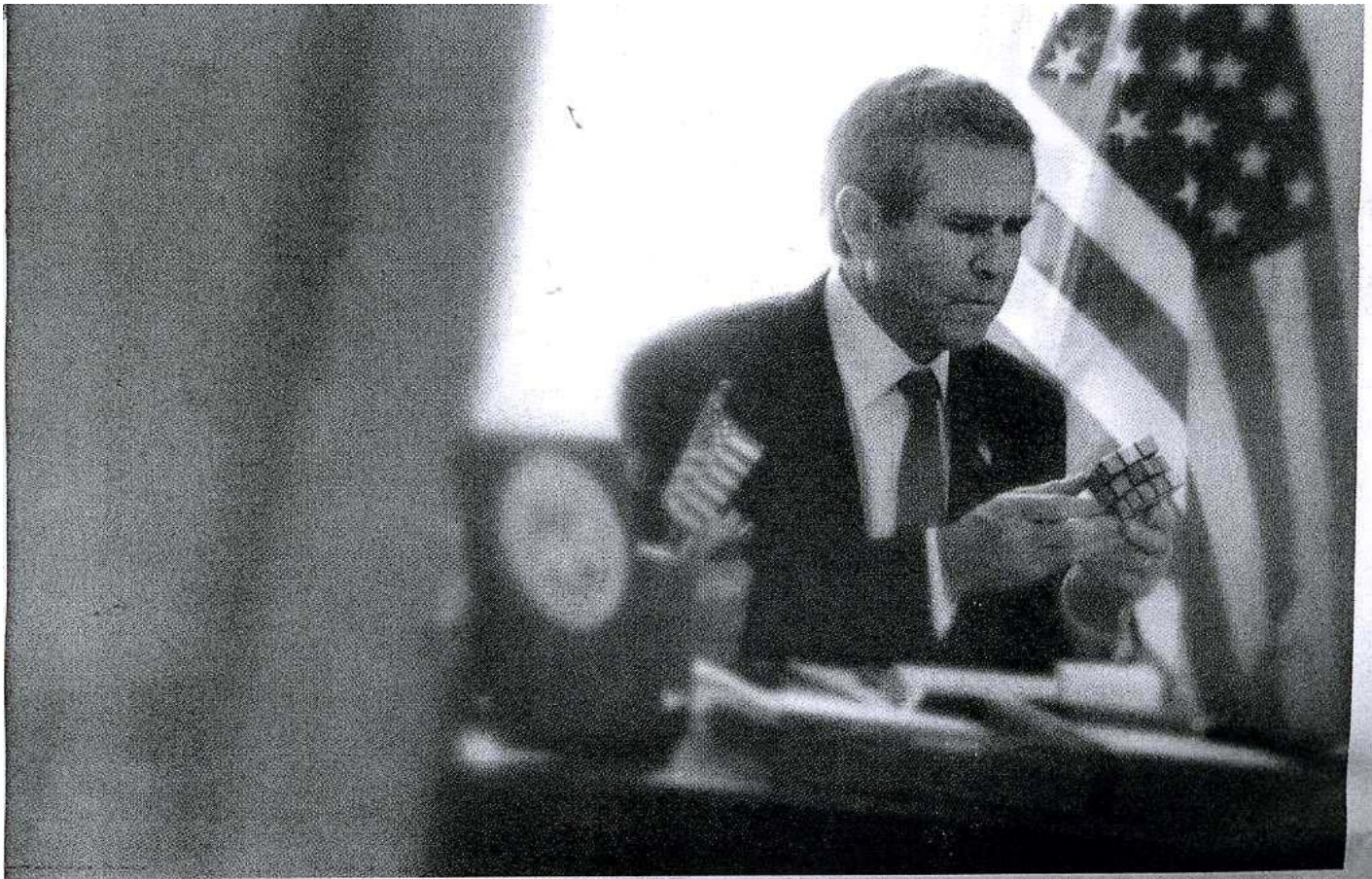
Sådan har de fleste set ham før. Ikke i virkeligheden, men i vores kollektive fantasi, mener Alison Jackson.

Samtidig med, at vi nyfægt fniser af billederne, der viser idolerne som ganske almindelige mennesker med laster og lyster som alle os andre, vil hun have os til at tænke over, hvor sandheden slutter og løgnen begynder, når det gælder vores interesse for de kulørte kendte.