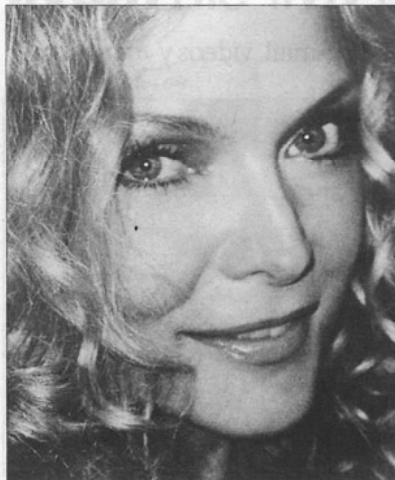
Michelle Pfeiffer, más cerca que nunca

composiciones del libro pertenecan a una fiesta celebrada en Milán en 2003, durante una semana de la moda, con Stella McCartney, Gwyneth Paltrow y Tom Ford. O esa que, protagonizada por Adrien Brody, Kate Hudson y Nicole Kidman, tanto recuerda a la mítica imagen de los años 60 en que Sophia Loren miraba con descaro el imposible escote de la oxigenada Jayne Mansfield. O, por qué no, los primerísimos planos de Claudia Schiffer, Michelle Pfeiffer, Jennifer Lopez y la misma Kidman, olvidándose todas del photoshop y demás retoques con tal de ser pilladas por su adorado artista. El mismo que hace un mes declaraba a la edición española de la revista «Glamour» que «me habría gustado ser retratado por Richard Avedon o Helmut Newton. ¿Desnudo?... soy demasiado tímido para eso».