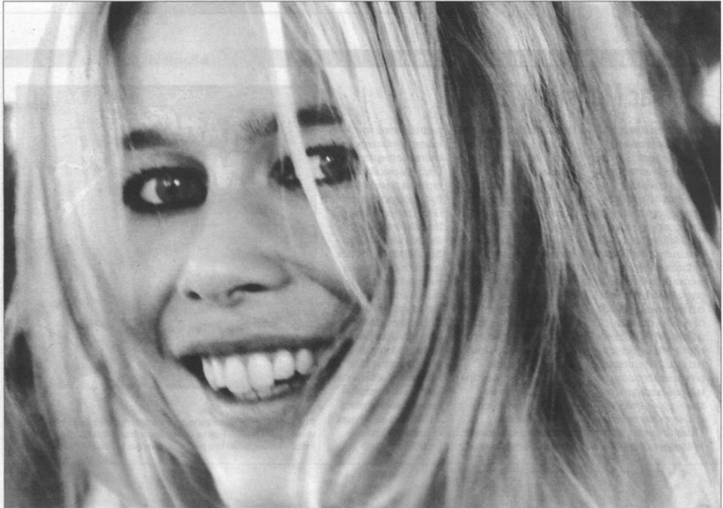
Primerísimo primer plano de Claudia Schiffer

Tampoco debió ser difícil convencer a David Beckham para que apareciera en «Let me in» afeitándose (con maquinilla eléctrica) en una instantánea tomada en Nueva York en 2003. Aunque quizá las mejores