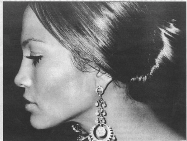
Jennifer Lopez muestra su mejor perfil