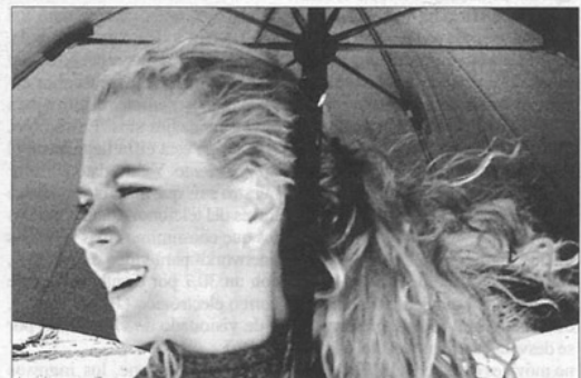
Nicole Kidman al natural