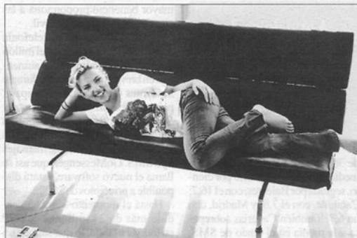
Scarlett Johansson, en un descanso de su ajetreada agenda