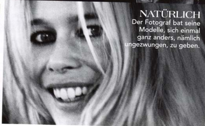
BECKS „Schau mal normal“, by Mario Testino.