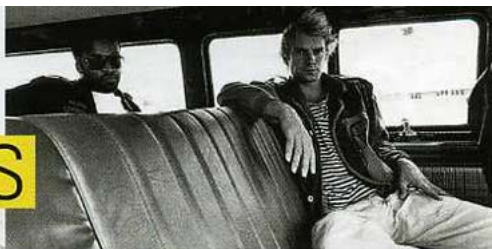
1 Summers fotografiert barfuß bei Studioaufnahmen 2 Sting, der früher Gordon Sumner hieß, im Kleinbus 3 Das Gedächtnis einer Band: Setlisten 4 Entspannt: Stewart Copeland liest ein Buch 5 Wasserpolizei: die Rocker im Pool