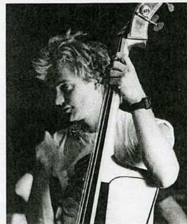
Sting ist noch immer gut für große Sprünge, wie das aktuelle Bild aus L.A. zeigt (links). Das Konzert dort war eines der ersten von Police seit 23 Jahren.