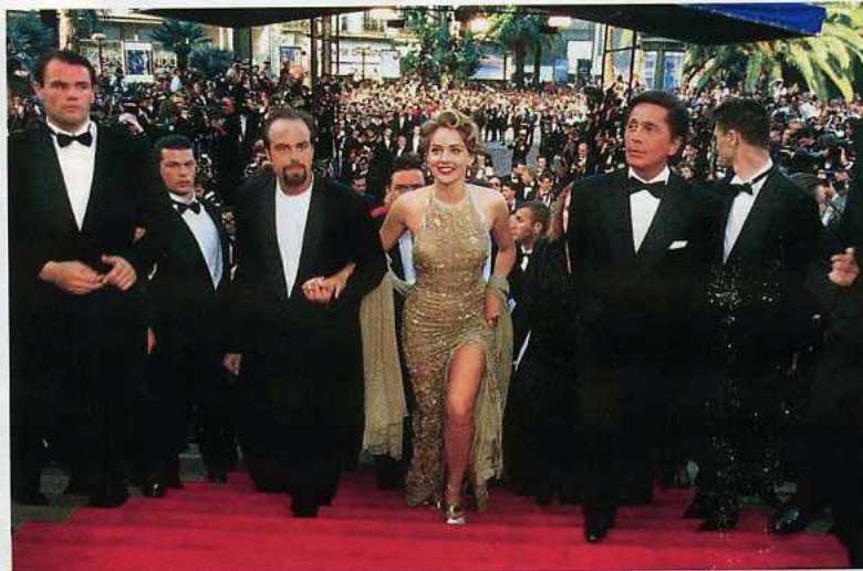
CANNES-FESTIVAL Als Sharon Stone 1995 in Valentino erschien, brauchte sie ein Heer von Leibwächtern. Die hautfarbene, vollständig mit Kristallblüten bestickte Robe hatte den speziellen Effekt, die Diva nackt erscheinen zu lassen

Valentino, Sohn eines Elektrohändlers, ist mit dem absoluten Blick zur Welt gekommen, so wie andere mit dem absoluten Gehör: „Eines Tages wurde mir klar, dass ich einfach alles sehe, alles beobachte. Ich kam in ein Haus und sah sofort den Fleck auf dem Sofa, nicht das