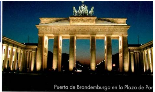
Puerta de Brandeburgo en la Plaza de París

En esta ciudad en continuo cambio todo es posible: hacer turismo, ir a la playa, sí, hemos dicho playa, visitar museos, ver la mejor arquitectura, tomar un tentempié informal o descubrir el restaurante más "in"... Tú decides.