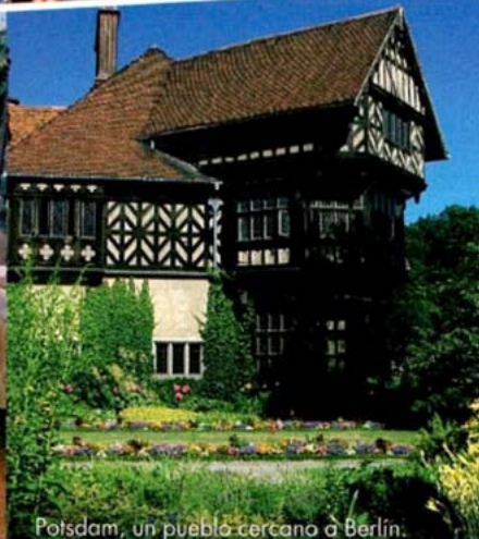
Potsdam, un pueblo cercano a Berlín.