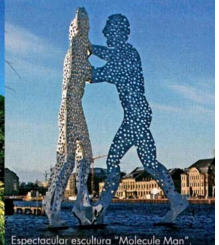
Espectacular escultura "Molecule Man".

cruzan puentes como el Oberbaumbrücke. Pasando el río se llega a la Alexanderplatz, "el Alex", como llaman los berlineses a su plaza más simbólica del antiguo Berlín oeste. Hacia la mitad del recorrido, en el "Gendarmenmarkt", se encuentra el clásico restaurante Borchardt. Es el lugar de reunión por excelencia (junto al restaurante Maxwell) de los personajes y políticos más renombrados. El Berlín moderno es espectacular. La desaparición del muro dejó un inmenso terreno edificable en el centro que aprovecharon los mejores arquitectos del mundo para llevar a cabo impresionantes proyectos. Allí surgió de la nada un barrio ultra moderno con resultados que se dejan ver. El ejemplo por excelencia es la Potsdamer Platz con el Sony Center, y el Reichstag que se ha convertido, gracias a su cúpula de cristal, en la segunda atracción turística (después de la catedral de Colonia). Callejear por Berlín es fascinante: no te pierdas el barrio Scheunenviertel, con sus cafés; entra en sus galerías de arte y en la Nueva Galería Nacional de Arte; pasea por sus parques (Tiergarten); vete de compras por el boulevard Kurfürstendamm... Además, las fiestas callejeras son todo un espectáculo, como la fiesta gay del 16 y 17 de junio, y la B-Parade, el 21 de julio. Y para relajarte, ¿que te parece la playa? (¡Sí! a la orilla del río); o sal a comer, la oferta es inmensa, y a tomar una copa: Greenwich, Newton, Riva... □