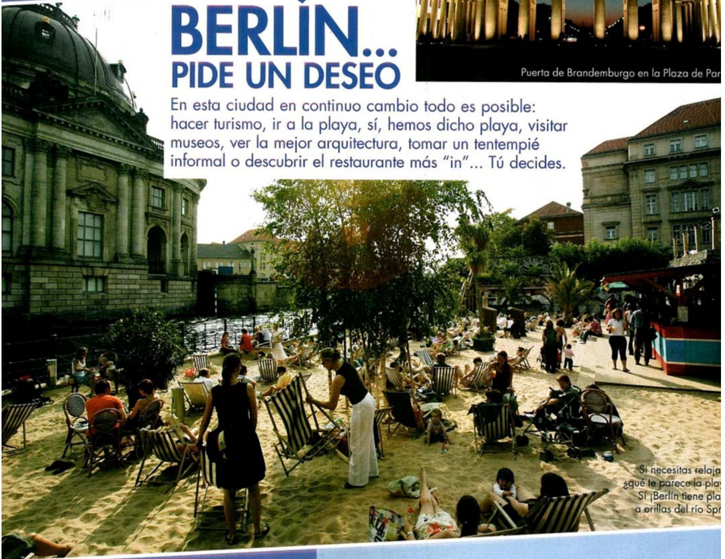
Si necesitas relajarte, ¿qué te parece la playa? Sí, Berlín tiene playas a orillas del río Spree.

Es quizá la capital europea que más ha cambiado en los últimos 15 años. Desde la caída del muro en 1989 hasta el día de hoy, el cambio ha sido tan extremo que barrios enteros son irreconocibles. Ha pasado de ser una ciudad interesante a ser un lugar absolutamente fascinante. Berlín rebosa vida y movimiento y allí siempre hay algo que hacer, algo nuevo que descubrir. Deja que te orientemos un poco. En el Berlín Clásico es imprescindible hacer una visita a los sitios de siempre, especialmente si es la primera vez que vas. La ciudad ha jugado un papel muy importante en la historia del siglo XX y, para entender el momento actual, no viene mal darse una vuelta por el pasado. Clásico hay poco conservado, pero lo que hay merece la pena. Una excursión obligatoria es a Potsdam, un pueblo cercano a Berlín donde se encuentran el palacio de Sanssouci, en estilo rococó, y el palacio Cecilienhof, una construcción que recuerda un poco a los cuentos. Clásicos se encuentran, por supuesto, también en el corazón de la ciudad. Un punto de partida ideal es la puerta de Brandeburgo, en la plaza de París, desde donde sale la avenida Unter den Linden, que lleva (pasando, entre otros edificios, por la Ópera y la Universidad) hasta la Isla de los Museos y la catedral. Estas están enmarcadas por el río Spree, que