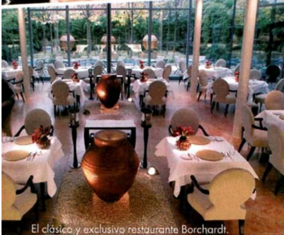
El clásico y exclusivo restaurante Borchardt.