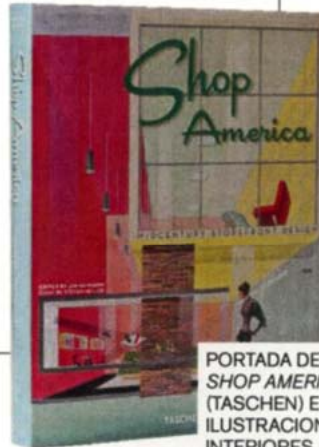
PORTADA DE SHOP AMERICA (TASCHEN) E ILUSTRACIONES INTERIORES.