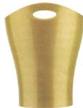
Bote de basura Garbino para Umbra.

■ Entiende y aprovecha la tecnología como muy pocos. Rashid es un amante de las curvas, los colores brillantes y la era digital, lo que ha hecho que venda millones y millones de dólares en productos alrededor del mundo.