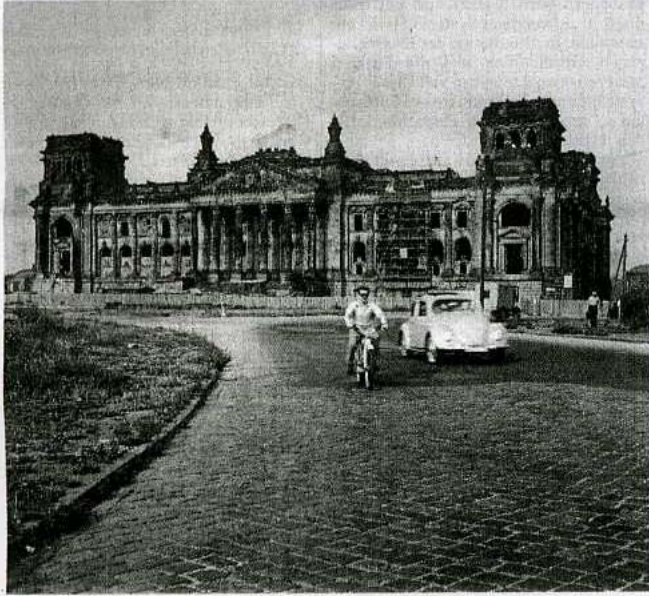
Leerstelle. Die Reichstagsruine im Sommer 1958. Zu dieser Zeit begannen die Renovierungsarbeiten. Bis 1971 wurde das Gebäude wieder aufgebaut.