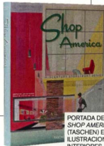
PORTADA DE SHOP AMERICA (TASCHEN) E ILUSTRACIONES INTERIORES.