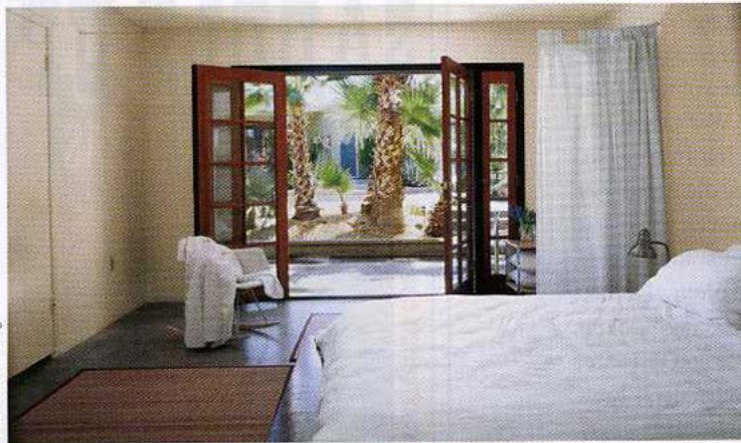
Hotels für kleine und große Fluchten: Rancho de la Osa in Tucson, Arizona (links unten), Hope Springs Resort in Desert Hot Springs, Kalifornien (links) und Werbetafel des Motel Thunderbird in Marfa, Texas (unten).