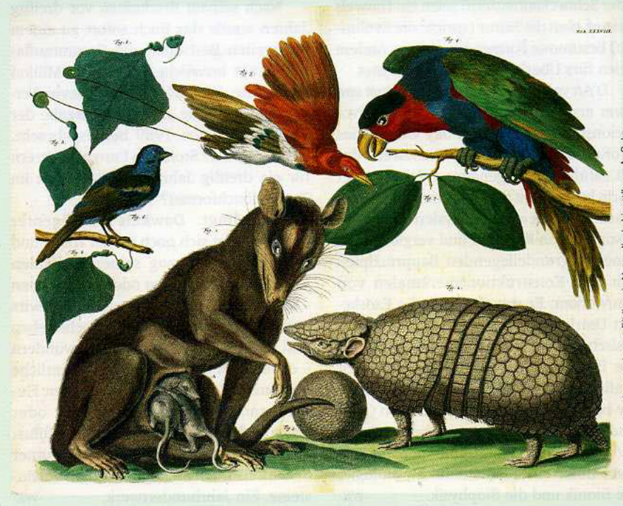
Anleitung aus dem besprochenen Bildband „Naturalienkabinett“ von A. Seba