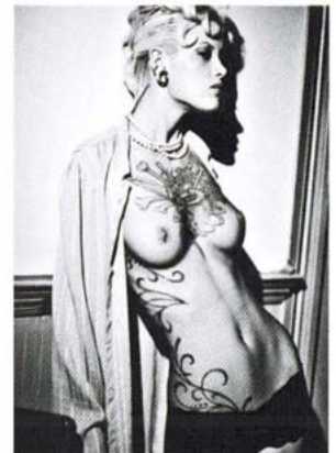
CUERPOS PERFECTOS. Las chicas más explosivas exhiben su belleza ante los fotógrafos de mayor prestigio.

Redefinir la sensualidad. Bajo esta premisa han trabajado genios como Ralph Gibson, Jan Saudek, Petter Hegre, Terry Richardson... y muchos nuevos talentos que han querido rendir un justo homenaje al mundo de la seducción. Insolentes, atrevidos, provocativos, exuberantes y terriblemente sexys... Así son los desnudos artísticos que reúne este referente del erotismo. www.taschen.com