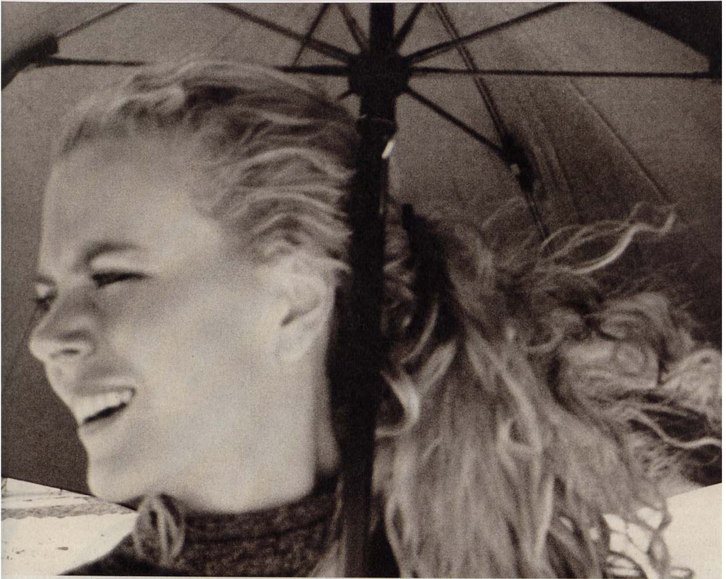
Nicole Kidman. Los Angeles, 2003. Abajo: Anjelica Huston y Matt Dillon. Los Angeles, 2003

—Claro. La diferencia es que el trabajo comercial está atravesado por su propia naturaleza, que es la venta. En cambio, el trabajo personal no tiene más razón de ser que el propio deseo del fotógrafo; no hay que vender nada. Finalmente, eres mucho más libre con tu trabajo personal.