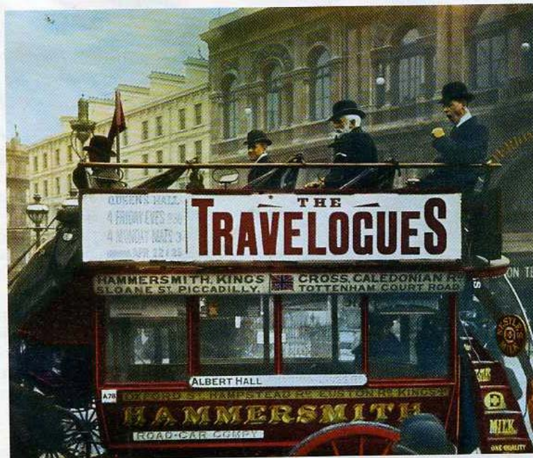
London, England 1904

A passionate traveller, entertaining speaker and gentleman, Burton Holmes spent decades exploring the world with his camera in the late 19th and early 20th century – and then showed his hand-colored pictures to the folks back home