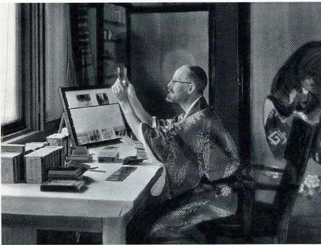
Holmes sichtet Dias in seinem Haus in Hollywood. Der Japan-Fan trug in seinen eigenen vier Wänden am liebsten einen Kimono // Burton Holmes inspects slides at his house in Hollywood. He was a great Japan fan and liked to wear a kimono when he was at home