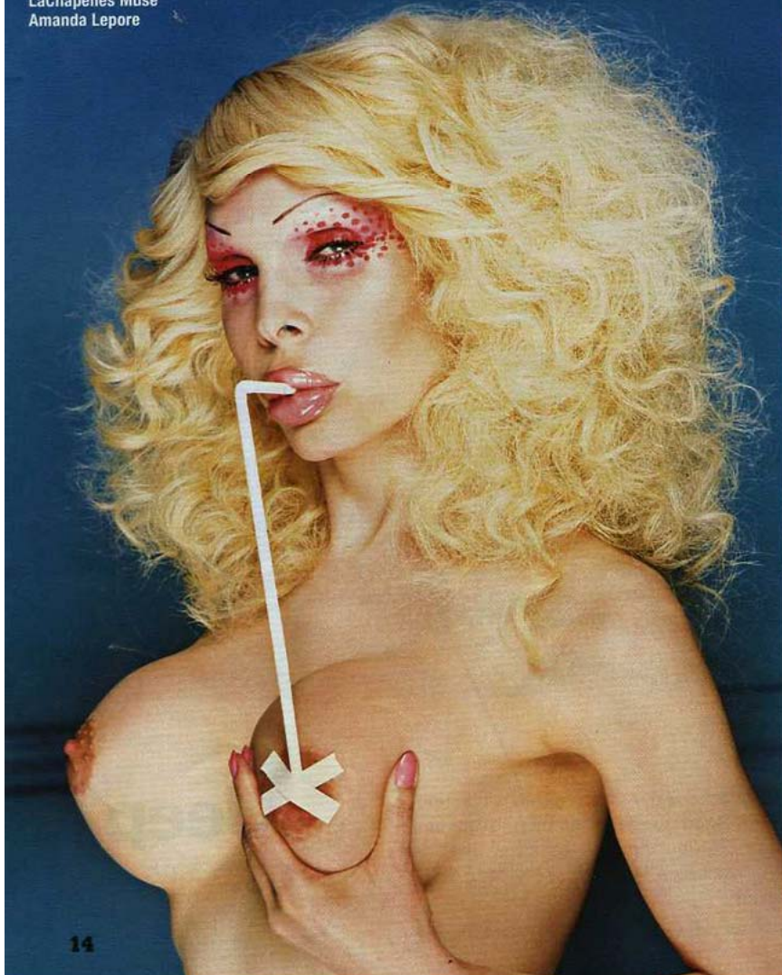
„Breast Feeding“ zeigt LaChapelles Muse Amanda Lepore

E in Trip vom Himmel zur Hölle und zurück sieht bei Starfotograf David LaChapelle so aus: Pferde naschen von Frauenbrüsten; Paris Hilton mischt fast nackt das Haus ihrer Großmutter auf; Jude Law steckt inmitten von Schweinen und Justin Timberlake in der Kluft des frühen Elton John. Die Fotos LaChapelles zeigen mystische Gelage zwischen Bibel und Porno, mit viel Brust und viel Gefühl – inszeniert im Stil barocker Tafelbilder. Die wilden Visionen des Starfotografen, den einst Andy Warhol entdeckte, sind zurzeit in der Berliner Galerie Jablonka, Kochstraße 60, zu sehen (bis 3. Februar). rr]