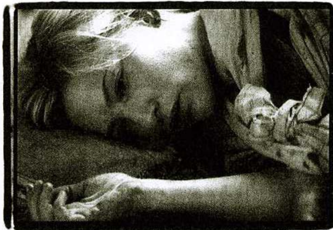
Cate Blanchett spielt die Amerikanerin Susan, die während einer Busfahrt von einer Kugel getroffen wird. „Babel“ wurde gerade für sieben Golden Globes nominiert.

Kleine Ursachen haben in den Filmen des Regisseurs oft eine große Wirkung. In diesem Fall ist es ein Schuss, der die Ereignisse ins Rollen bringt. Zwei marokkanische Jungs schießen aus Übermut mit einem Gewehr ihres