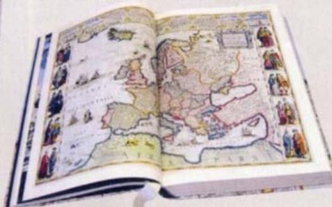
▲ PORTADA E INTERIOR del "Atlas Maior" de Joan Blaeu.