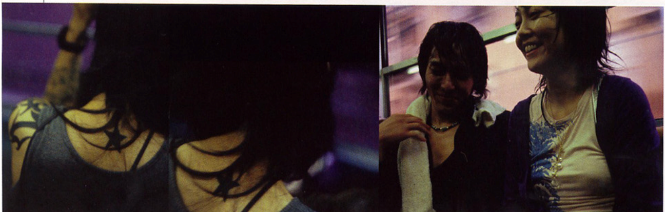
Arriba: KINO VERDÚ